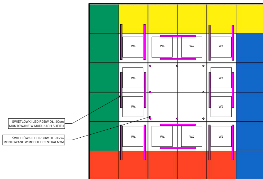
WIDOK Z GÓRY - SCHEMAT ROZMIESZCZENIE ŚWIEŁÓWEK